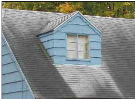
Extenso crecimiento de algas

Las algas necesitan humedad y una temperatura adecuada para crecer. El rocío es la principal fuente de humedad. Las algas se encuentran principalmente en el sudeste, pero pueden crecer en todo el territorio nacional. Suelen crecer en la parte del techo que queda hacia el norte, ya que, generalmente, en esa sección reciben menos luz solar. Las algas se adaptan muy bien a condiciones climáticas extremas.