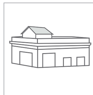
Plano a dos aguas